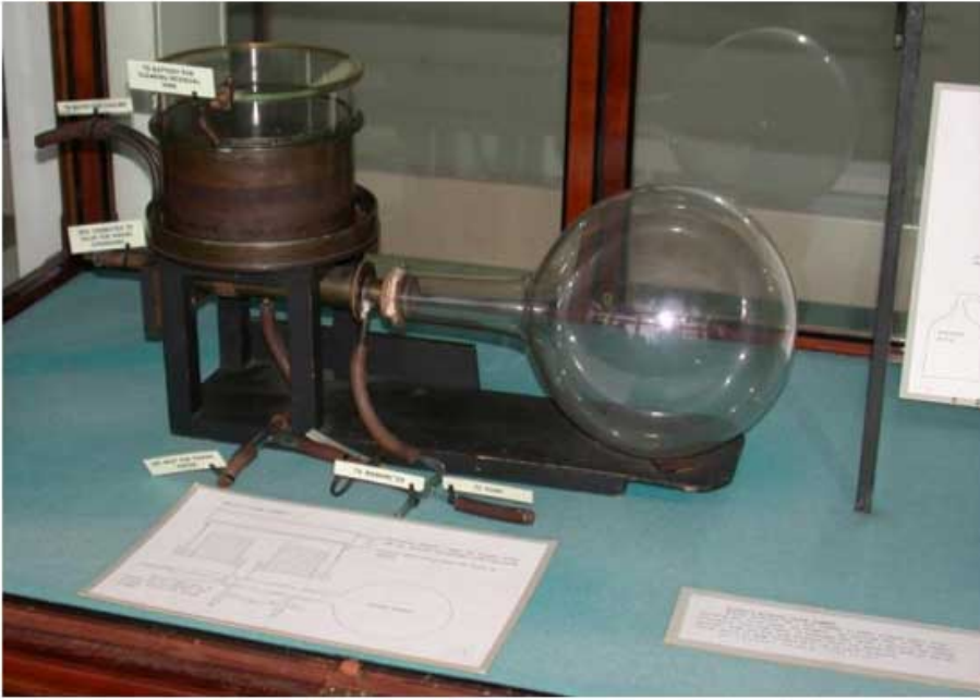
Cavendish Museum Cambridge, Original Nebelkammer von 1911

Donnerstag, den 29. März 2012 um 16:05 Uhr - Aktualisiert Freitag, den 24. Januar 2014 um 12:25 Uhr