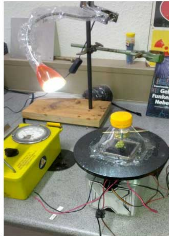
Nebelkammer mit CPU-Kühler und PC

http://www.burda.com/.../pages/cabinet_12.jpg